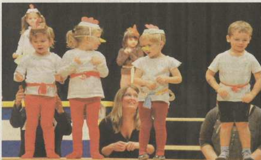
Die Allerjüngsten zeigten ihr Showtalent beim Eltern-Kind-Turnen.

Alle zwei Jahre gibt es diese Turnvorstellung. Bereits ein Jahr vorher beginnt jeweils der TV Leissigen mit der Grobplanung. Und von Monat zu Monat geht es weiter in die Feinplanung. So wurden die letzten Wochen genutzt, um das Programm, welches von den Riegenleitern in eigener Regie ausgearbeitet wurde, zusammenzuführen. Die hochstehenden zwei Vorführungen am Wochenende zeigten, dass die Leissiger überaus tolle und kreative Leute sind. Dabei sein «färg» und macht Spass.