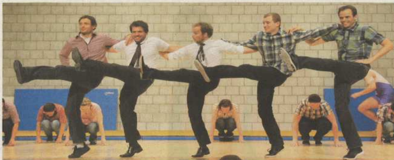
Einen schwungvollen Abend lieferte der Turnverein Leissigen unter dem Motto «Wer wird Millionär?».

Eigentlich hätte die Turnvorstellung in der Turnhalle um 20 Uhr beginnen sollen. Daraus wurde aber nichts, denn es fänden sich immer mehr Zuschauer ein. Die fleissigen Helfer mussten blitzartig Stühle und Tische rankarren, damit alle einen Platz fanden. Unterdessen stieg die Nervosität hinter der Bühne. Die Eltern-Kind-Riege stand parat und wenige Minuten später ging der rote Vorhang auf. Die Jüngsten im eleganten Hühnerkostüm zeigten ihr Können. Es war einfach herzlich, dem zuzuschauen, und der Applaus von den 350 Besuchern war mehr als verdient. Die Geräteriegen der Damen, Herren und Jugendlichen, das Kinderturnen,